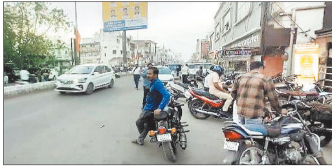
शहर के हृदय स्थल कचहरी चौक के पास सड़क पर वाहनों की पार्किंग।