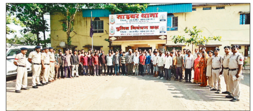
पुलिस की गिरफ्त में पकड़े गए वारंटी।

के मामले में फरार चल रहे 2 स्थाई वारंटियों को भी थाना बलौदा पुलिस द्वारा पकड़ा गया। वहीं लूट, चोरी, महिला एवं बच्चों संबंधी अपराधों में कुछ फरार आरोपी भी पकड़े गए। कोतवाली पुलिस ने 5 असामाजिक तत्वों को पकड़कर कार्यवाही की। अभियान के दौरान थाना जांजगीर पुलिस द्वारा 4 गिरफ्तारी वारंटियों एवं 4 स्थाई वारंटियों, चौकी नैला से 2 गिरफ्तारी एवं 3 स्थाई वारंटियों, थाना बलौदा से 7 स्थाई वारंटियों एवं 2 गिरफ्तारी, थाना अकलतरा 4 गिरफ्तारी वारंटियों एवं 18 स्थाई वारंटियों, थाना मुलमुला 7 स्थाई वारंटियों, थाना पामगढ़ 8 स्थाई वारंटियों, थाना शिवरीनारायण 7 स्थाई वारंटियों, थाना