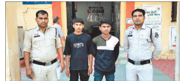
पकड़े गए चोरी के आरोपी।

महिला आरक्षण बिल के बाद नए परिशीलन से होने वाले आगामी चुनाव में महिलाओं के लिए सीधे तौर पर एक-तिहाई सीट आरक्षित होंगी। आने वाले समय में राजनीतिक परिदृश्य बदला बदला सा नजर आएगा। अब विधानसभा और लोकसभा में नारी शक्ति की भागीदारी बढ़ेगी। नए परिशीलन के बाद 2028 के विधानसभा चुनाव और 2029 के लोकसभा चुनाव में सीट बढ़ेगी। वहीं महिला जनप्रतिनिधियों को इन सीटों पर 33 प्रतिशत का आरक्षण मिलेगा। इसे लेकर जांजगीर चांम्पा जिले की महिला नेत्रियों में उत्साह देखा जा रहा है। महिलाओं के लिए अवसर में बढ़ोतरी होगी, जिससे नारी शक्ति को सीधा लाभ मिलेगा। आगामी चुनाव में महिलाएं विधायक और सांसद की कुर्सी पर कब्जा होने बढ़ बढ़ कर अपनी सहभागिता निभाएंगी।