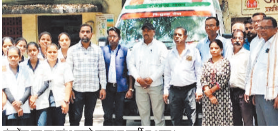
एंबुलेंस का शुभारंभ करते स्वास्थ्य कर्मी व अन्य।

हरिभूमि न्यूज ►► हरदीबाजार हरदीबाजार प्राथमिक स्वास्थ्य केंद्र में दो वर्षों से 108 एंबुलेंस सेवा बंद हो गई थी। जिसकी वजह से क्षेत्र के मरीजों को बहुत परेशानियों का सामना करना पड़ रहा था। निजी व किराए के वाहनों से स्वास्थ्य केंद्र पहुंचना पड़ता था। हरदीबाजार प्राथमिक स्वास्थ्य केंद्र अंतर्गत कुल 22 गांव व 7 उप स्वास्थ्य केंद्र आते हैं। मरीजों को बारिश का मौसम हो चाहे गर्मी या ठंडी का मौसम आने-जाने में बड़ी परेशानी हो रही थी अब 108 एंबुलेंस सेवा प्राथमिक स्वास्थ्य केंद्र हरदीबाजार जिसका लोकेशन भी हरदीबाजार में सुचारू रूप से चालू हो गया है अब मरीज