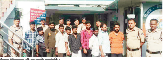
पुलिस गिरफ्त में स्थायी वारंटी।

हरिभूमि न्यूज ►► कोरबा पुलिस अधीक्षक सिद्धार्थ तिवारी के निर्देशन में जिले के तीनों अनुभागों के अनुभागीय अधिकारियों तथा समस्त थाना व चौकी प्रभारियों के द्वारा स्थायी वारंट व गिरफ्तारी वारंटों की धरपकड़ हेतु अभियान चलाया गया। इसी कड़ी में विभिन्न थाना चौकी के द्वारा 10 व 11 अप्रैल को कोरबा पुलिस द्वारा सघन दबिश अभियान चलाकर लंबे समय से फरार चल रहे वारंटियों को गिरफ्तार